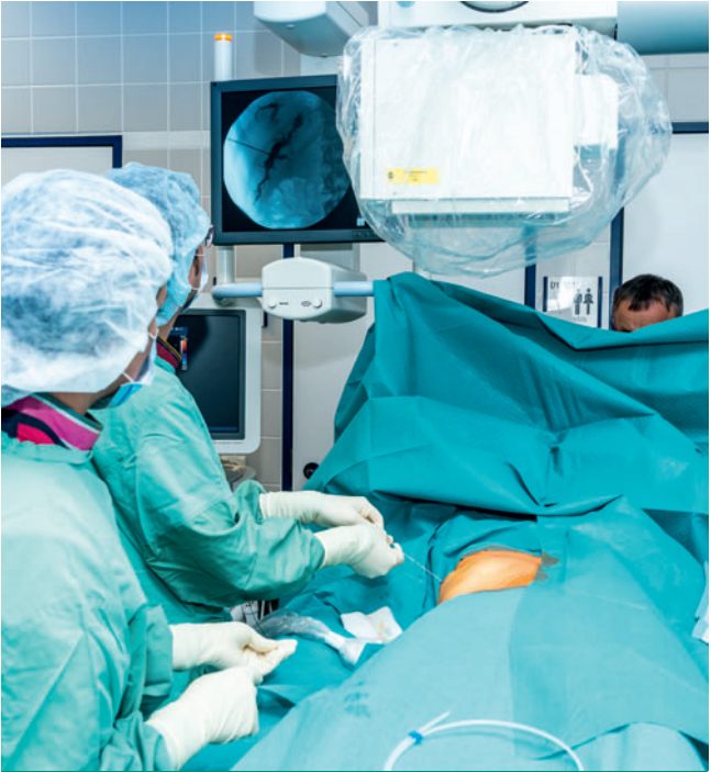
Während des Eingriffs: Punktion der Gallenwege