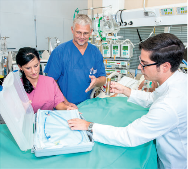
Endoskopische Notfallversorgung auf der Intensivstation