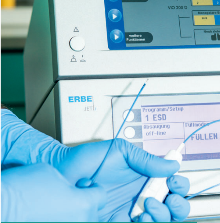
Endoskopische Submukosadissektion mittels ERBE Hybridknife®