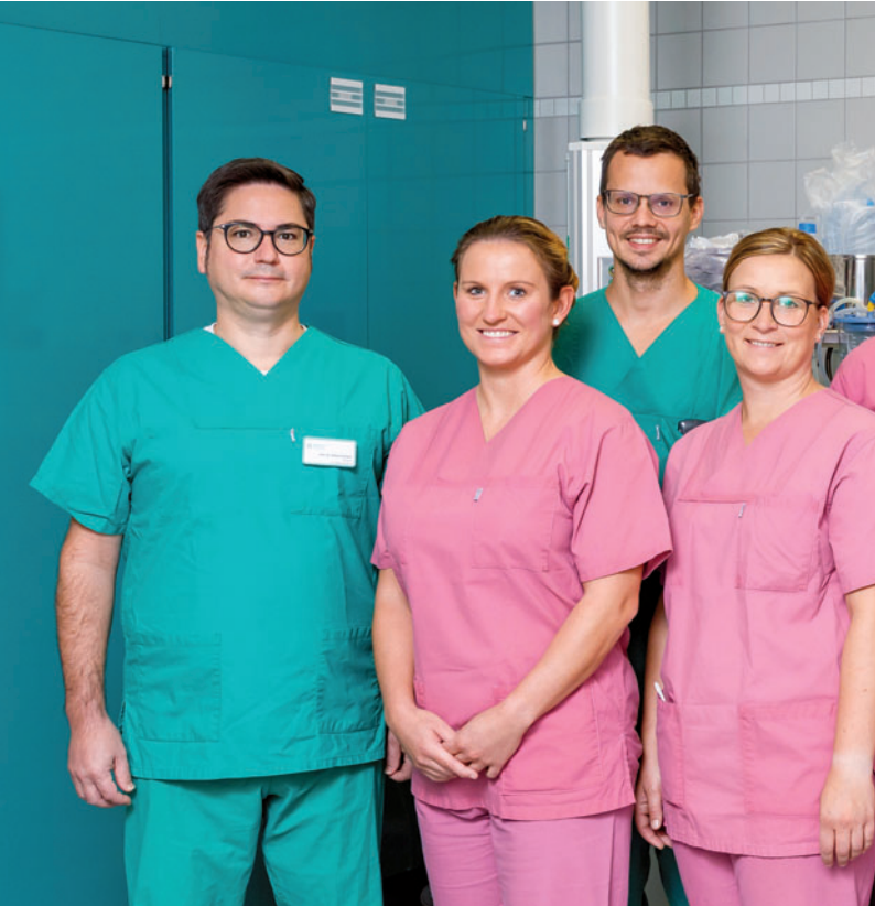
Das Team im Endoskopiezentrum Südbrandenburg